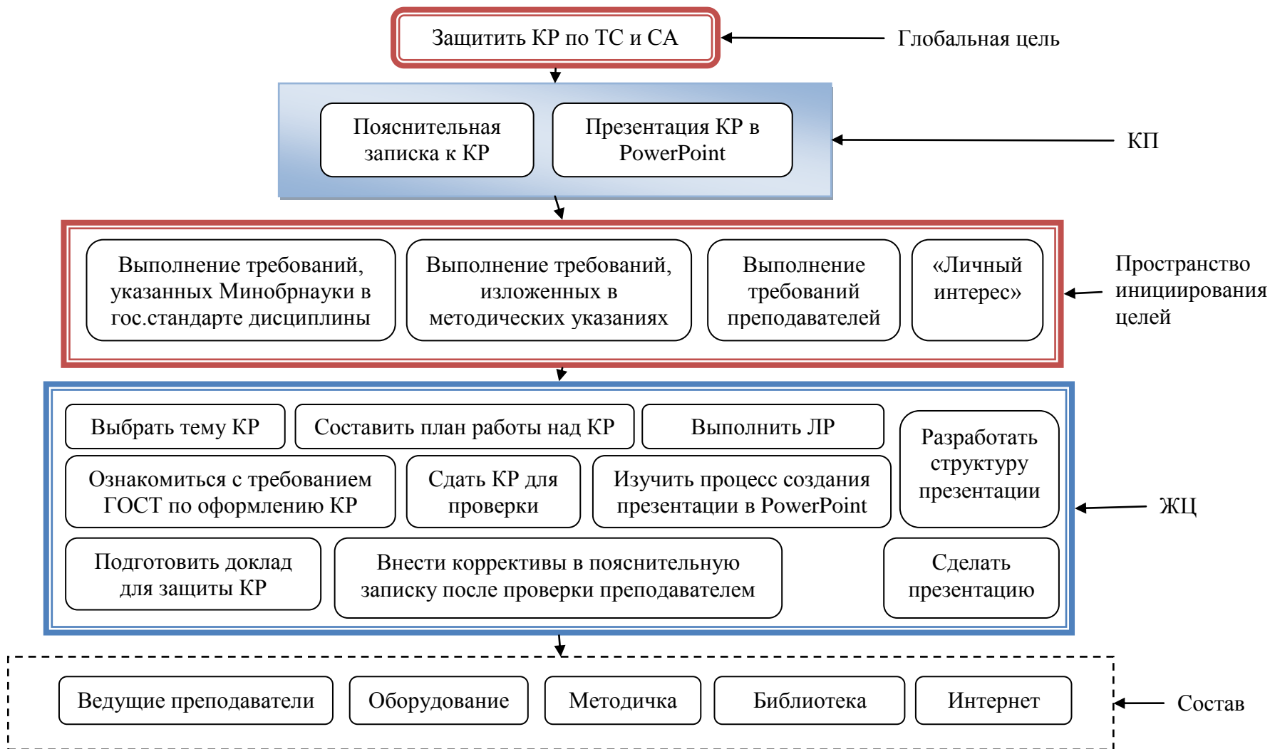
Рисунок 2 – Дерево целей и функций для процесса защиты курсовой работы по ТС и СА